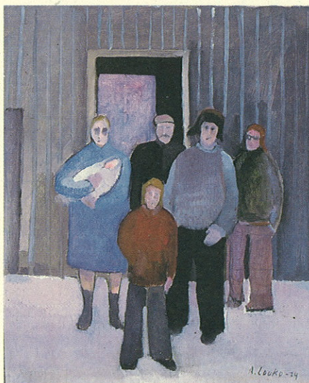
Kotiinpalaajat De återvändande 1976.