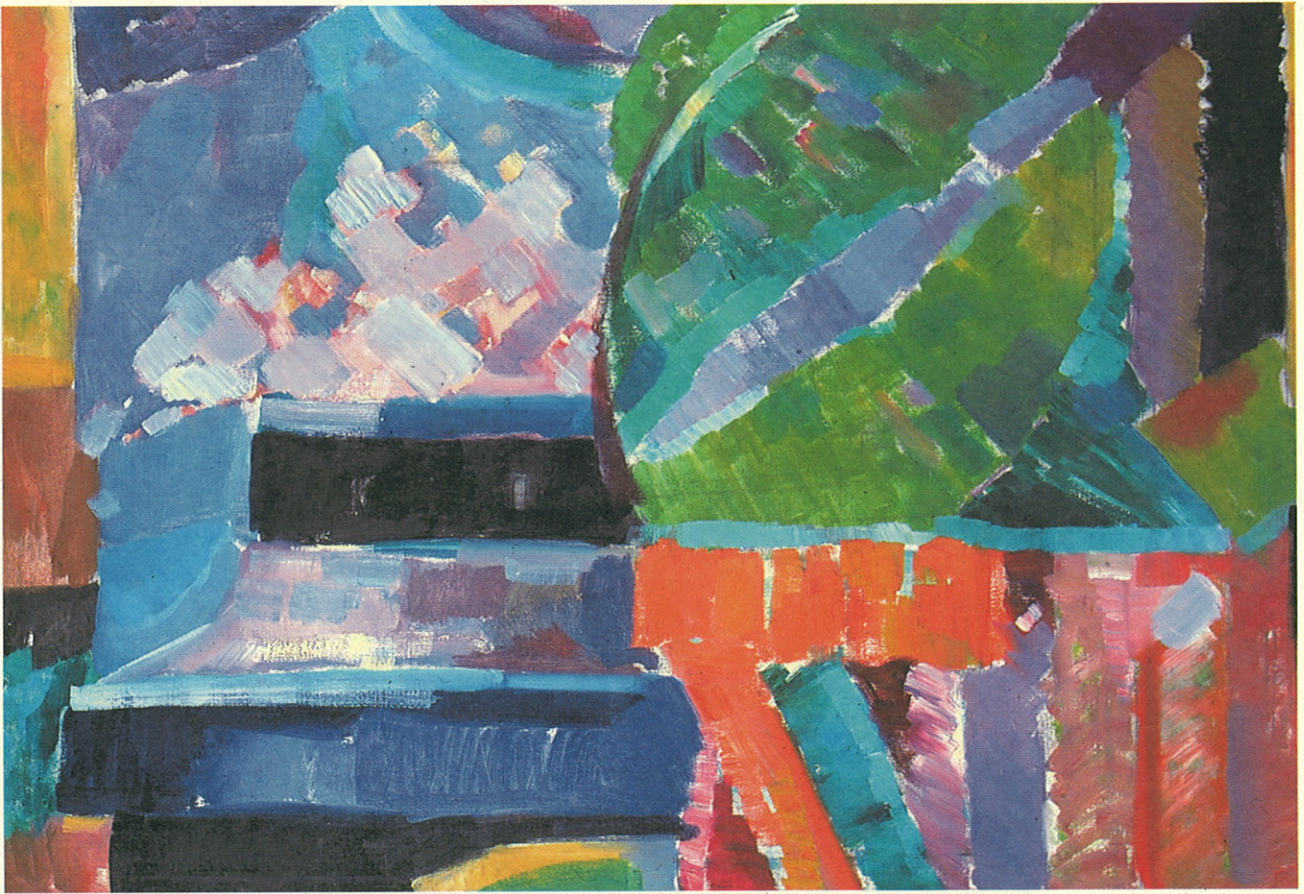
Kesäkaupunki II 1976. Luonnos Krstiinankaupungin postitalon taidekilpailuun. Sommarstad II 1976. Skiss till konsttävlingen för Kristinestads posthus.