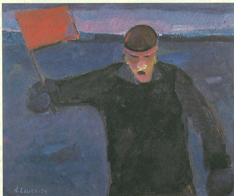
Ampu tulee! Skottet går! 1974.

Från år 1958 började "kampen och striden" för att åtminstone någon av dessa visioner skulle få konkret form i skulpturer eller på duk. Dessförinnan hade han målat i